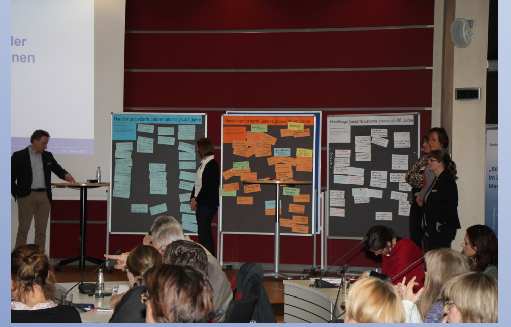
Ergebnisse der Pinnwandstationen, 1. Bildungskonferenz Landkreis Marburg-Biedenkopf