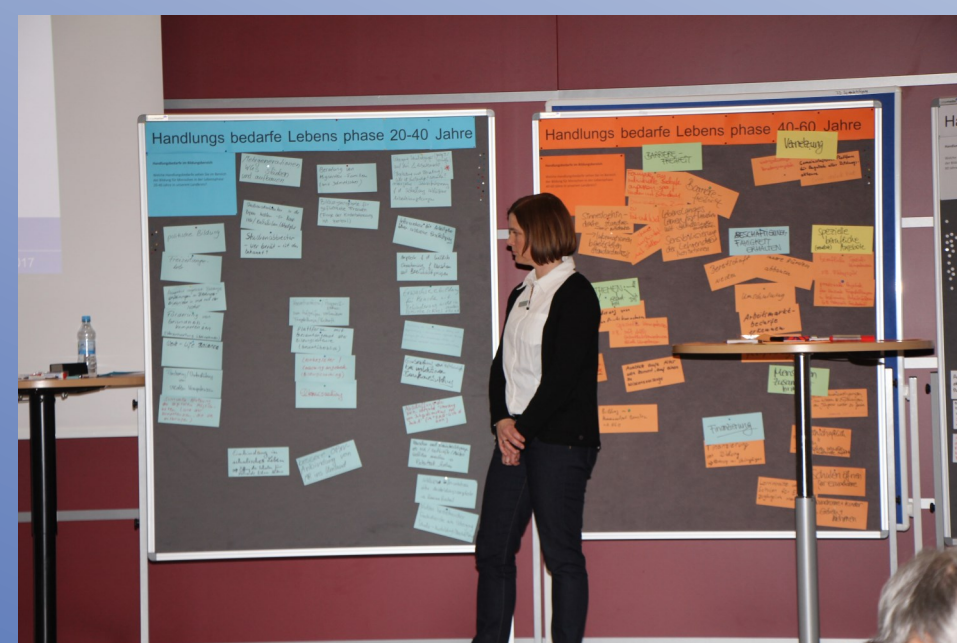
Ergebnisse der Pinnwandstationen, 1. Bildungskonferenz Landkreis Marburg-Biedenkopf