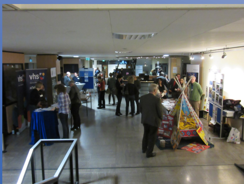
Marktplatz der Möglichkeiten, 1. Bildungskonferenz Landkreis Marburg-Biedenkopf